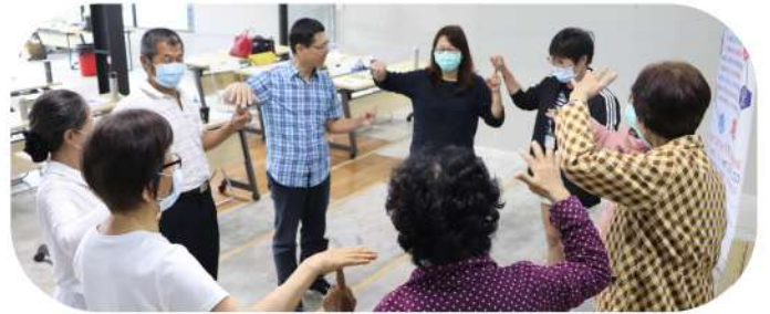
◎學員於共識營前進行破冰暖身遊戲(上二圖)