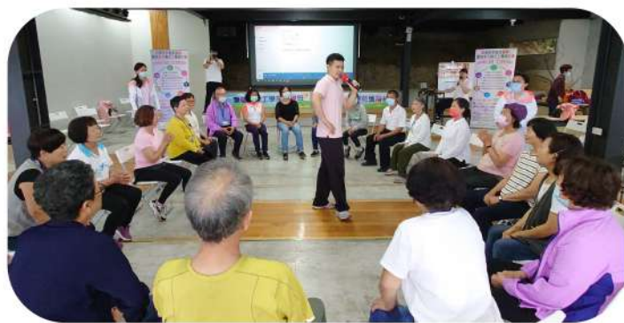
◎學員們進行各類團體動力遊戲，認真討論、溝通取得團隊共識，為團隊爭取勝利！

莫忘初心，方得始終，期望所有愛健康志工學苑的學員們，在做志工服務的這條漫漫長路上，能持續快樂學習、專心致「志」，服務成長，讓我們共同將好的服務藉由您我的手，帶給每一位長輩、傳到每一個地方，讓社會充滿歡笑、愛與幸福。