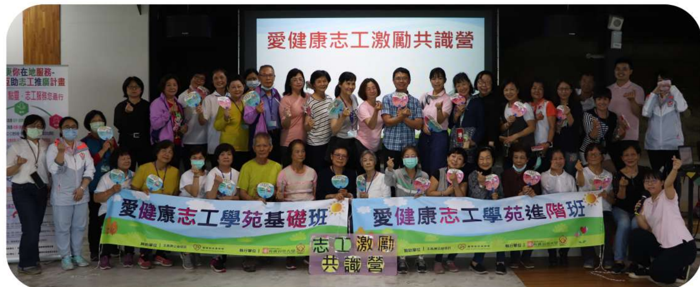
◎志工學苑第四期暨第三期進階班志工激勵共識營合影

莫忘初心，方得始終，期望所有愛健康志工學苑的學員們，在做志工服務的這條漫漫長路上，能持續快樂學習、專心致「志」，服務成長，讓我們共同將好的服務藉由您我的手，帶給每一位長輩、傳到每一個地方，讓社會充滿歡笑、愛與幸福。