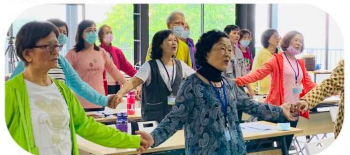
◎學員共同合唱關於愛的祝福歌曲