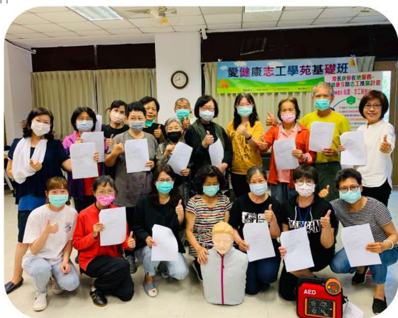
◎志工學苑第四期學員全體通過基礎急救訓練

經過學習與實作練習，志工學苑第四期基礎班學員一致通過課堂的急救模擬考試，大家真是太棒了！