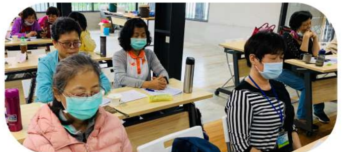
◎閉上眼睛，靜下心想一想，幸福是什麼？

林牧師不僅分享親身服務的經驗，更藉由生動的影片，讓學員們了解，想要服務，要先懂得需求；認識您的社區、您的家、認識您自己，才知道自身有什麼，可以給別人什麼。在課程的尾聲，志工學員們學習互相稱讚身邊的每一位夥伴，嘗試大聲說出：「你真棒、謝謝你、我愛你！」，大家都笑了，原來感到開心幸福，是這麼簡單！