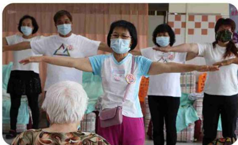
◎妤恬帶領日照據點長輩進行體適能動作