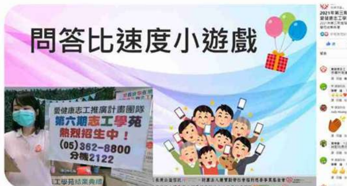
◎線上互動小遊戲，讓結業典禮增添不少趣味