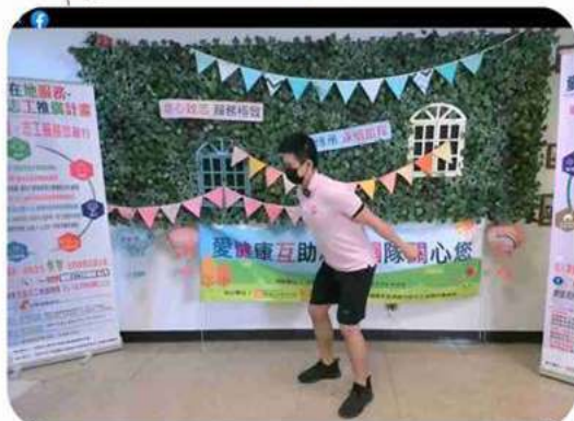
◎茂昌老師帶領觀眾進行居家體適能