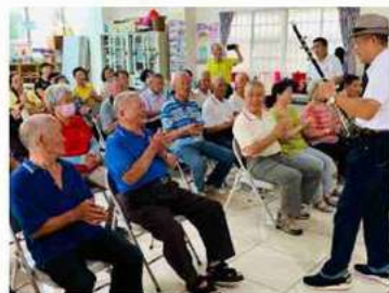
◎團隊至社區進行音樂輔療