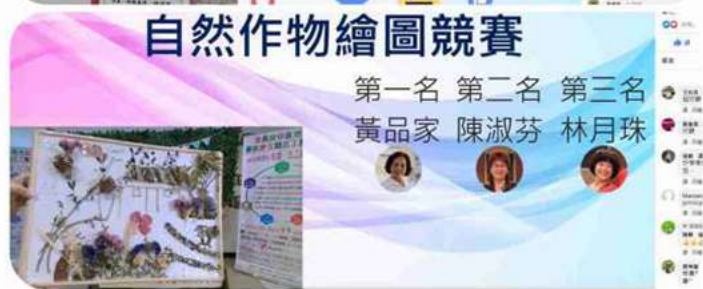
◎線上直播頒發全勤獎及展示得獎作品，備感榮譽