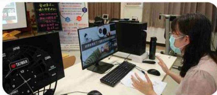
◎老師帶領學員於遠距教學過程實際演練口語表達 ◎老師仔細教導學員製作授課簡報技巧

愛健康志工種子師資專業培訓課程，內容豐富且實用，期盼所有學員們經過培育，成為專業的種子師資，與愛健康志工團隊共同前進偏鄉社區，為民眾與長輩提供課程宣導與服務，我們一起加油！