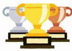
◎志工工作坊動態與靜態成果展獲獎學員英雄榜